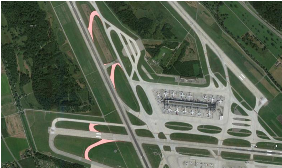
Abb. 1: Lage der geplanten Schnellabrollwege Pisten 28 und 34

Folgende Rollwege sind geplant: Ab Piste 28 die Abrollwege B7 und L7 (nach Norden zum Rollweg BRAVO bzw. Süden zum Rollweg LIMA) und ab Piste 34 die Abrollwege 34N und 34S (Arbeitsbezeichnungen um Verwechslungen mit bestehenden Rollwegen der Piste 34 zu vermeiden), beide nach Osten zum Rollweg ECHO). Der Rollweg ECHO wird leicht angepasst und die Befeuerungsanlagen der Rollwege im Projektperimeter müssen ergänzt werden.