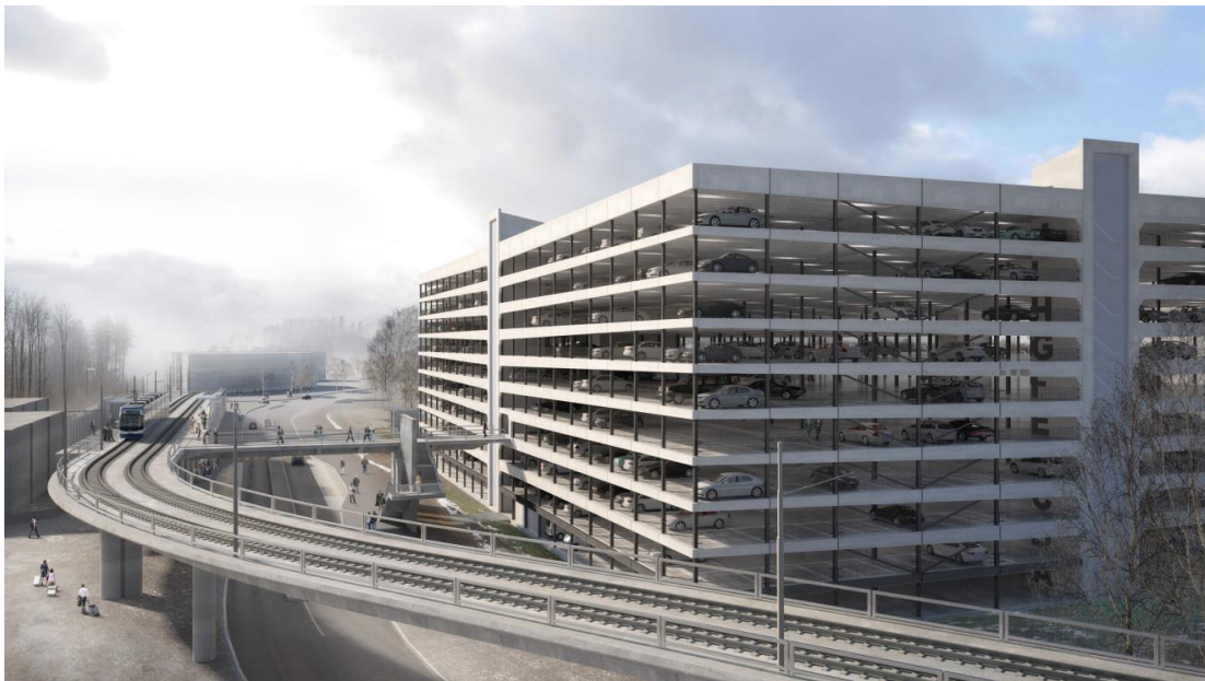
Abb. 1: Visualisierung des P10 mit Anbindung an die Glatttalbahn

P10. Eine Konzentration im Nordosten der Parzelle führt zu einer optimalen Anbindung an den Viadukt der Glatttalbahn, wobei die bestehende Passerelle in die Mitte der an die Flughafenstrasse angrenzenden Fassade zu liegen kommt. Der Zugang von der Passerelle her erfolgt im 3. Obergeschoss direkt in die Servicezone. Diese besteht aus einem grosszügigen Eingangsbereich mit den WC-Anlagen, einem Betriebs- bzw. Lagerraum, den Ticketautomaten, den Liften und einer Treppenanlage. Zudem werden auf diesem Geschoss sämtliche Behinderten-Parkplätze angeordnet. Ein weiterer Zugang befindet sich an derselben Stelle im Erdgeschoss und stellt somit eine Anbindung zu den Buslinien sicher.