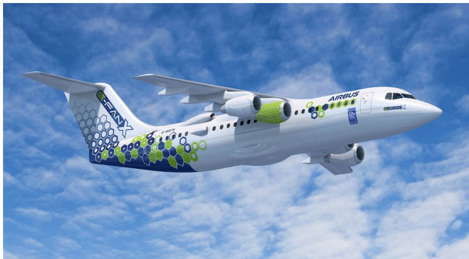
Entwurf des Flugzeuges des Projektes E-Fan x

Um Möglichkeiten und Grenzen genauer auszuloten, arbeiteten Airbus und Rolls-Royce bis im Frühjahr 2020 an einem Hybrid-Antriebsstrang mit 2 MW 6 Leistung (Projekt E-Fan X) 7 . Der Hybrid-Antrieb sollte in ein altes Regionalflugzeug vom Typ BAE-146 eingebaut werden, wobei eines der vier konventionellen Triebwerke durch ein elektrisches Triebwerk von 2 MW Leistung ersetzt wurde. Der Erstflug war für das Jahr 2021 geplant. Eine Leistung von 2 MW in einem fliegenden Demonstrator wäre indessen erst ein Bruchteil der Leistung gewesen, welche beispielsweise für den Start eines typischen Passagierflugzeuges der Baureihen Airbus A320 oder Boeing B737 mit 180 Sitzplätzen benötigt wird. Solche Flugzeuge benötigen beim Start mindestens 30 MW Leistung. 8 Über die genauen technischen Schwierigkeiten, welche zum Stopp des Projekts E-Fan X führten, haben Airbus und Rolls-Royce aus betrieblichen Geheimhaltungsgründen geschwiegen.